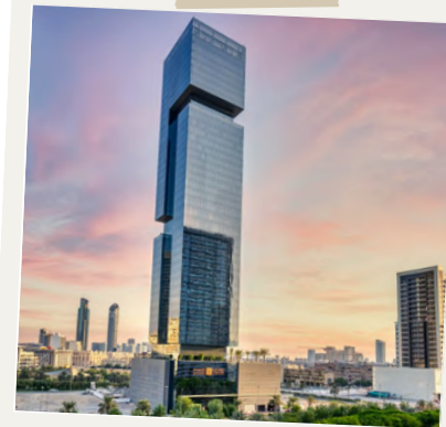
THE FIRST COLLECTION @JUMEIRAH VILLAGE CIRCLE

Gli appassionati di fitness adoreranno la palestra aperta 24 ore su 24, attrezzata con pesi e macchinari cardio, il massimo per tenersi in forma!