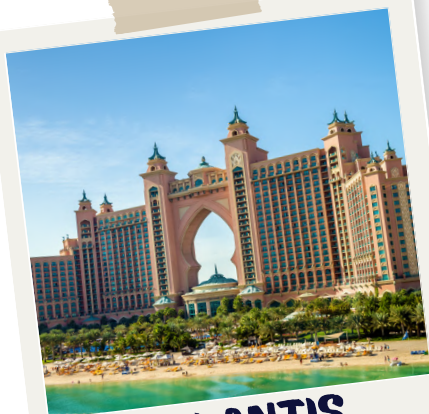
ATLANTIS THE PALM