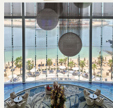
CONRAD ETIHAD TOWERS

Le piscine esclusive, la spiaggia bianca privata, la cucina di altissimo livello, la vista mozzafiato dall'Observatory Deck At 300 sono solo alcune delle top experience da vivere in questo hotel unico.